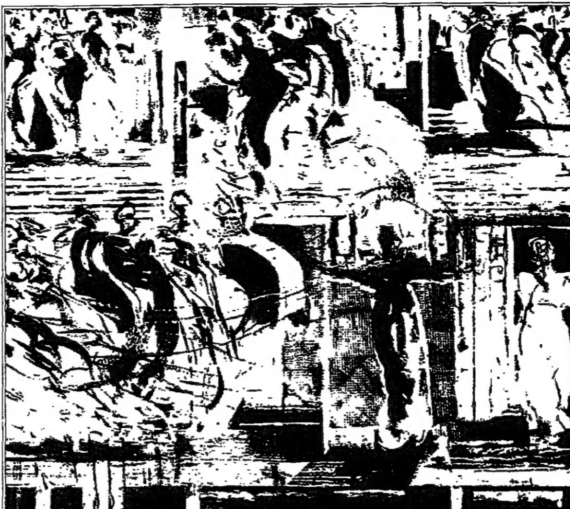
من أعمال العرض

التصريف دون كايح، وبصورية واحدة لغرضاته حيث لاخطا يسمح به في هكذا تقنية يتجزأ ما يبرق، فتأقينا الوجوه بقشاعتها وأحترقها، تسقط الأتعة، يزحم موضع الوحة بالحياة، ويهتو يتغامعون مع فرضي وترتيب، في عالم مسوح نظري مذبذبة هنا ورووس على أسنة رسوم لتطير في الفضاء، خورف في زاوية، خراب في أخرى، صعود الى النهاية، وساخر من حياة، كوة نور تصارع السواد، مسافة للمصاب يتربع على عرشها رب ما، طبول محترقة، قنبوسون، مهرجون، بياها، ومسبح يرب كل ما عشت في زاوية عابا مسندا جذعه على صليبه، في حياة تتعاجل فيها للشخص،